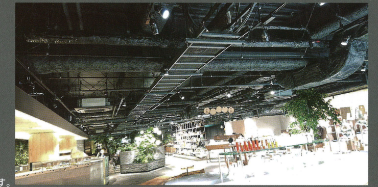
GOOD NATURE STATION(京都府京都市)

日本製鉄の黒ZAM®(ザム)は溶剤系塗料を使用せず、高耐食めっき鋼板ZAM®の表面を黒色化処理することで黒色意匠性を備えたクロムフリーの環境にやさしい素材です。内装用建材のほかにも自動車、家電まで幅広い用途での活用が期待されています。