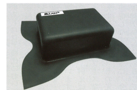
黒ZAM®の加工例(プレス(絞り)加工)